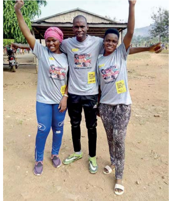
La membresía de Amnistía Internacional Togo reunida para la campaña Escribe por los Derechos, 2019. Cada año movilizan a personas de todos el país para que participen.

Desde las atrocidades cometidas en la Segunda Guerra Mundial, los instrumentos internacionales de derechos humanos, empezando por la Declaración Universal de Derechos Humanos, proporcionan un sólido marco para el establecimiento de legislación nacional, regional e internacional dirigida a mejorar la vida de las personas en todo el mundo. Los derechos humanos pueden considerarse leyes para los gobiernos, pues crean para éstos y para las autoridades del Estado la obligación de respetar, proteger y hacer efectivos los derechos de las personas que están bajo su jurisdicción y también para quienes están fuera de ella.