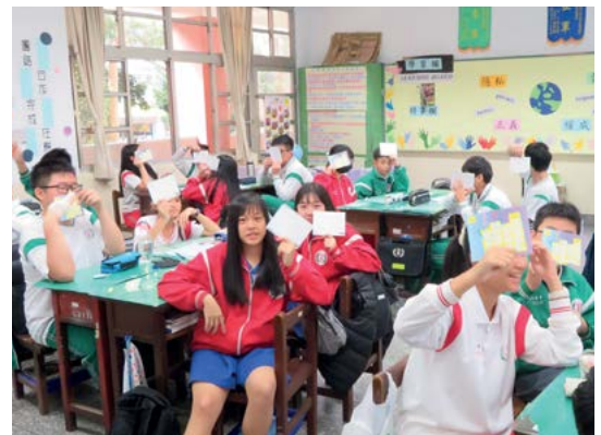
Estudiantes y docentes de Taiwán organizaron eventos de envío de cartas con Amnistía Internacional para la campaña Escribe por los Derechos 2019. © Amnesty International Taiwan

Si los métodos de aprendizaje participativo no te son familiares, consulta el Manual de Facilitación de Amnistía Internacional antes de empezar. Lo encontrarás en www.amnesty.org/es/documents/ACT35/020/2011/es/